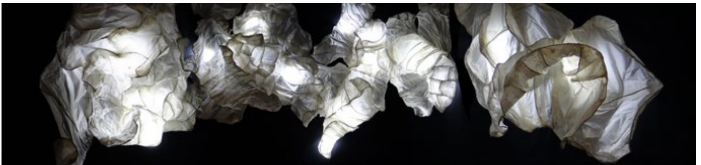
Vue de l'installation Leila , musée de la Palmeraie, Biennale de Marrakesh 2016