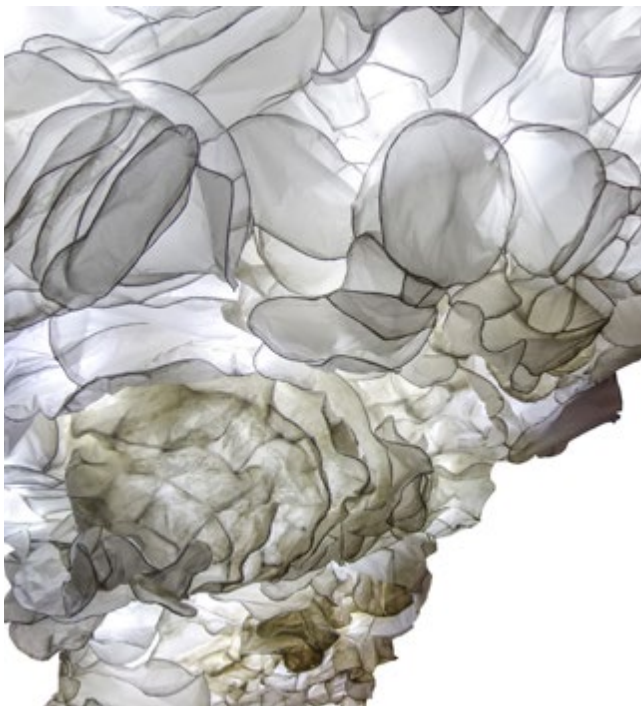
Détail de l'installation, Loo&Lou Gallery, l'Atelier