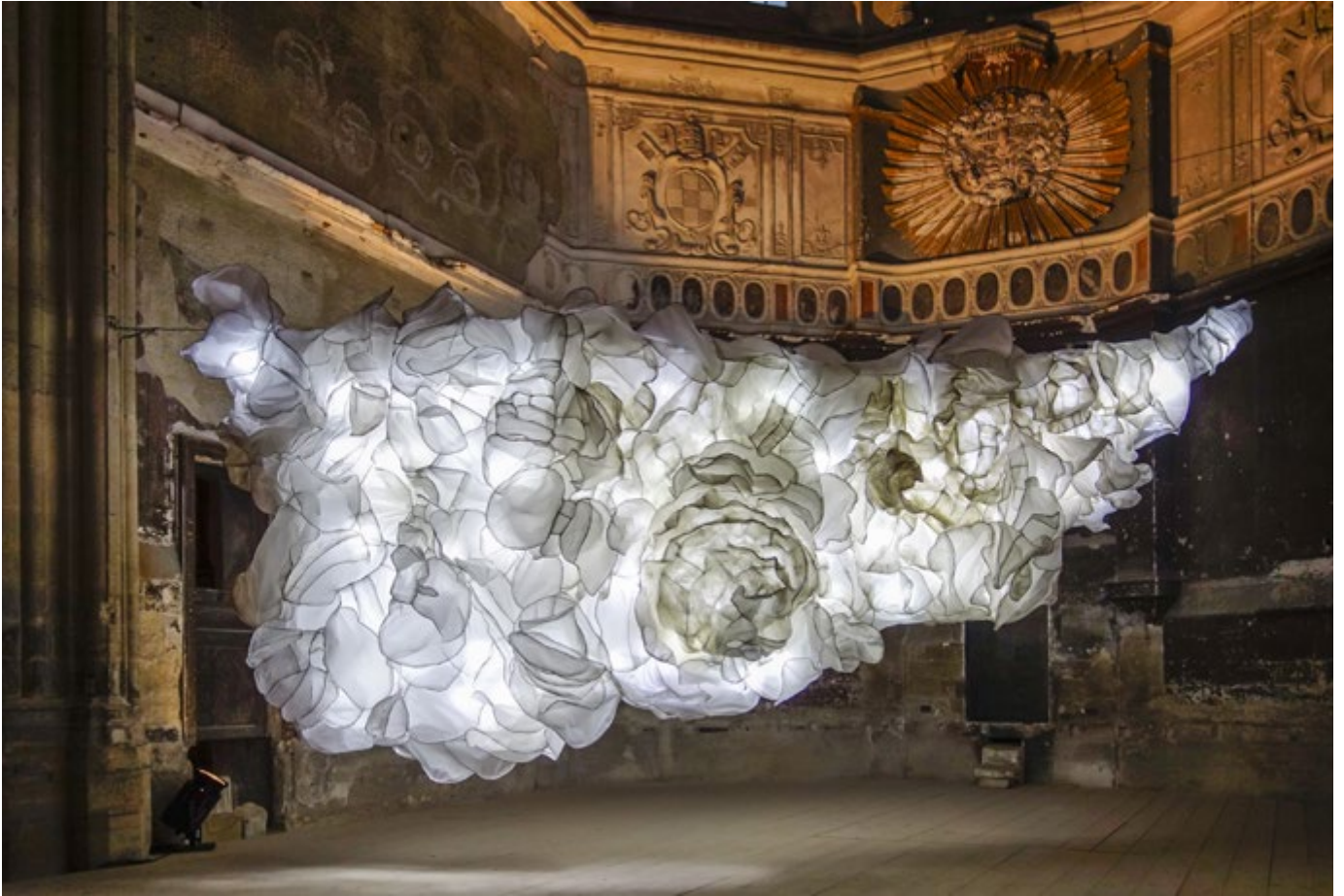
Vue de l'installation Coexistence , église des célestins, Avignon